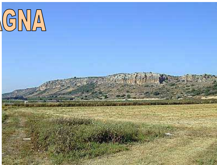
Il Monte Carmelo

Giungere felicemente alla "santa montagna" che è Cristo Signore... Questo è lo scopo per cui ogni cristiano soffre, combatte e prega (cfr A.