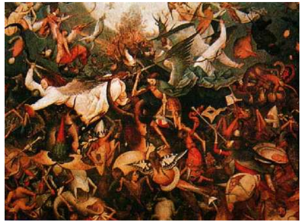
Peter Brügel il Vecchio, La caduta degli angeli ribelli , 1562

Le creature spirituali condividono con l’uomo il fatto di essere dotate di intelletto, volontà e libertà e di essere, perciò, capaci di conoscere,