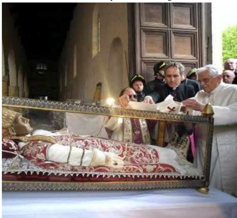
Benedetto XVI, in visita a L'Aquila dopo il terremoto, rende omaggio alle spoglie di Celestino V deponendo sulla sua urna il pallio indossato il giorno del suo insediamento

È sempre Dio che guida la sua Chiesa, e lo fa per mezzo di uomini dei quali non cambia la natura. Essi diventano così, con tutto il peso dei loro limiti umani, segno e strumento dell'agire di Dio nella storia degli uomini e della Chiesa. Nel caso in esame, credo che Dio abbia voluto darci, nelle vicende umane e spirituali di entrambi questi due straordinari Pontefici, un insegnamento. Giovanni Paolo II ci ha insegnato il valore della sofferenza offerta in unione alla Vittima Sacrificale Cristo Gesù (qualcosa di simile ave-