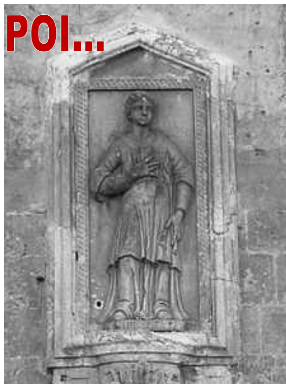
Santa Teopista, facciata del duomo di Matera

Il nome è significativo, soprattutto perché inizia con "Teo", radice che richiama il greco Theos , Dio. Meno facile è stato decifrare la seconda parte, "pista"; il termine richiama il greco pistis , fede. Dunque, a quella bambina venne dato un