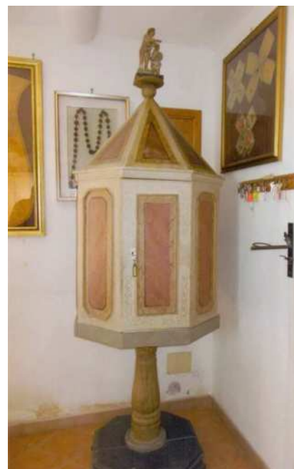
Il battistero del 1912 ancora esistente nella sacrestia di Nocella

L'eccezionalità della decisione traspare da diversi particolari: la richiesta del parere favorevole del parroco, la provvisorietà della concessione, il fatto che comunque l'acqua battesimale doveva essere portata da Montepertuso (verosimilmente dopo che era stata benedetta in parrocchia nella celebrazione del Sabato Santo), l'obbligo per il rettore di Nocella di comunicare «volta per volta» al parroco l'avvenuto conferimento del battesimo, perché questi potesse annotarlo nel Libro dei Battezzati, che doveva comunque essere unico; solo il parroco, infatti, poteva rilasciare i relativi certificati; tuttavia, onde evitare il rischio che la comunicazione andasse perduta, si faceva grave obbligo al rettore di Nocella di annotare. «in via privata», in un apposito “libro”, i battesimi amministrati a Nocella. Sarebbe interessante recuperare queste annotazioni, che però al momento sembrano scomparse. ■