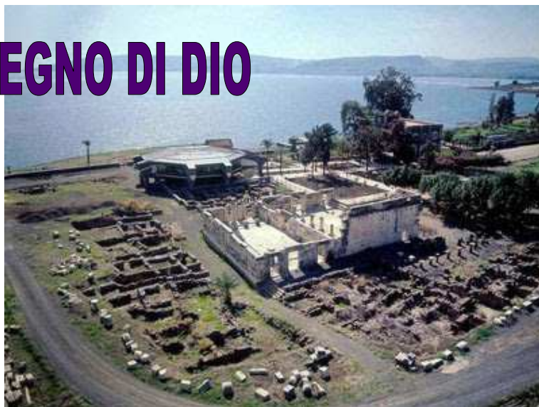
Cafarnaon: al centro la sinagoga; in alto, la chiesa a pianta ottagonale costruita nel 1990 sui resti della casa di Pietro.

Raccontata così, la scena sembra non avere niente di straordinario: è il racconto di uno dei tanti miracoli compiuti da Gesù. Concentriamo la nostra attenzione su quel gesto: si avvicina a quella donna e la prende per mano; è un gesto