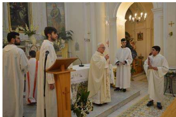
1. Panoramica della benedizione delle palme. - 2. L'assemblea liturgica; in prima fila i ragazzi che riceveranno la prima comunione il 19 maggio prossimo. - 3. L'altare della reposizione. - 4. Lettura della Passione di Nostro Signore Gesù Cristo secondo Giovanni. - 5. Rientro della processione del Cristo morto. - 6. L'inizio della Solenne Veglia Pasquale. - 7. «Cristo Luce del mondo!»- Altre foto sono visibili sul nostro sito web: www.montepertuso.it