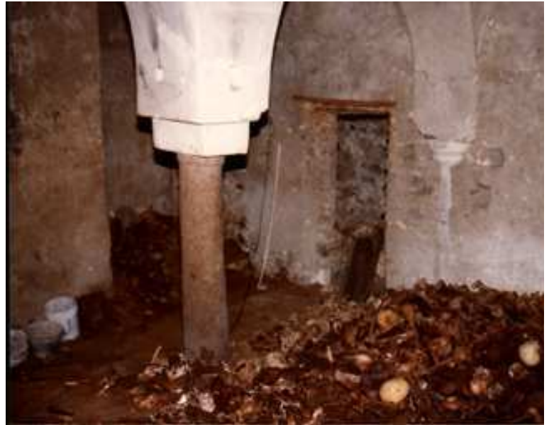
La cripta dell'antica abbazia di Santa Maria di Positano come si presentò al primo accesso dei volontari nel 1983. In primo piano, resti mortali forse provenienti da altre sepolture un tempo esistenti nella chiesa superiore. Al centro della foto, il varco che immetteva nello spazio destinato alla sepoltura dei sacerdoti.

Nel 1840-42 nelle annotazioni di morte degli abitanti di Nocella rispunta via via più frequente l'indicazione "sepolto nell'edicola della Santa Croce"; ormai però quella cappella non era più adibita al culto, per cui formalmente l'osservanza dell'editto del 1804 era salva. Per Montepertuso, invece, appare l'indicazione "sepolto nel cimitero della parrocchia", che certamente non attestava l'esistenza di un cimitero secondo le prescrizioni dell'editto napoleonico, ma si riferiva alle stesse sepolture preesistenti, alle quali non si accedeva più dall'interno della chiesa, bensì dall'esterno (lato mare). Questi sotterfugi si spiega-