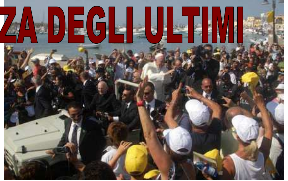
Lampedusa, 8 luglio 2013

E questo totale ed estremo affidamento è ciò che accomuna il capo della sinagoga e la donna malata nel Vangelo (cfr Mt 9,18-26 ). Sono episodi di liberazione . Entrambi si avvicinano a Gesù per ottenere da Lui ciò che nessun altro può dare loro: liberazione dalla malattia e dalla morte. Da una parte abbiamo la figlia di una