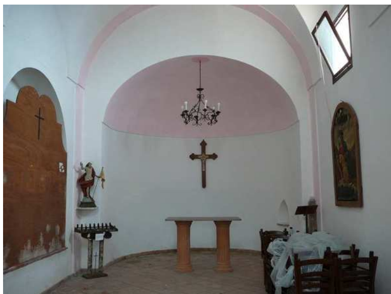
Interno restaurato dell'antica cappella della Santa Croce (o dell'Addolorata), accanto al cimitero di Nocella. A destra s'intravede il quadro della Pietà

A Positano solo alcune delle chiese del territorio avevano una o più sepolture; tra esse in particolare si distinguevano la chiesa del Rosario e, ovviamente, l'abbazia di Santa Maria. In quest'ultima vi era una sepoltura comune (ricavata dagli inizi del secolo XVII nell'antica cripta) e, all'interno di questa ma separata da una parete divisoria, la sepoltura dei sacerdoti, posizionata al disotto dell'attuale abside; vi erano, inoltre, almeno altre cinque sepolture annesse ad altari laterali; la più utilizzata era la sepoltura della Confraternita della Buona Morte, detta “Terrasanta”, al disotto della chiesa dell'Oratorio (oggi museo della Villa Romana). L'uso di tutte queste sepolture durò ben oltre il 1806 (anno in cui l'Editto di Saint Cloud fu esteso all'Italia Meridionale); in pratica si continuò ad usarle, sebbene sporadica-