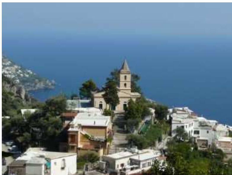
La chiesa parrocchiale non è solo la sede giuridica della Parrocchia, ma è anche il centro da cui parte e verso cui tende tutta l'attività pastorale.

Come accennavo sopra, omelia e catechesi sono due strumenti molto diversi, sebbene i contenuti siano gli stessi: la Parola di Dio. L'elemento più evidente che le rende diverse è il fatto che nell'omelia ci si deve accontentare di ascoltare ciò che il celebrante dice: non si può intervenire, non può esserci dibattito, né richiesta di chiarimenti; i fedeli devono starsene lì, in ascolto più o meno attento, ma passivi. La catechesi, invece, consente di interloquire con colui che la tiene (non necessariamente il parroco!), si possono fare domande, obiezioni e richieste di qualsiasi genere, ov-