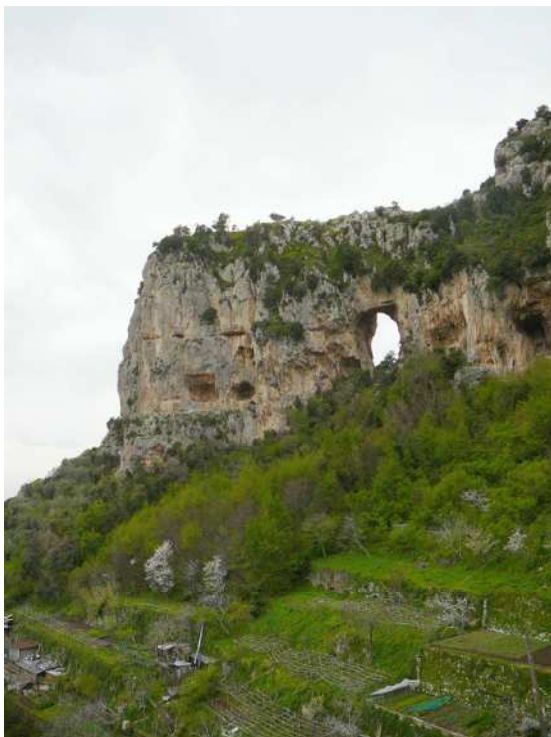
La montagna forata di Montepertuso e, in basso, i piccoli appezzamenti di terreno della Campola

Parto da un caso geograficamente molto vicino a me. Nel corso delle ricerche sui miei antenati, mi sono imbattuto nel nome di una località: il Casale. I libri parrocchiali dei defunti, come ho già avuto modo di dirvi, sono a questo riguardo una fonte eccezionale di infor-