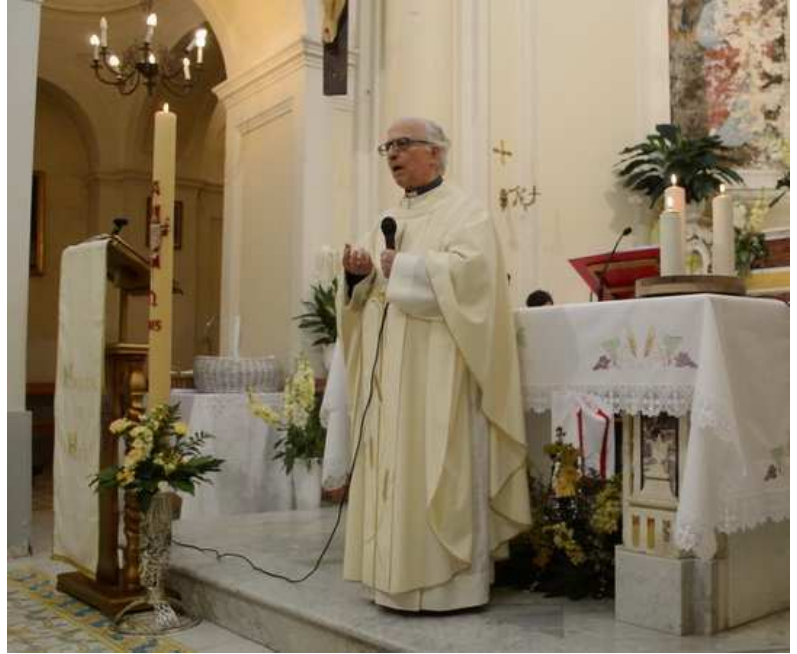
Nell'omelia il parroco esercita il ministero profetico (il compito di insegnare) ricevuto con l'Ordine Sacro.

Potrebbe sembrare una situazione fallimentare, ma non lo è. Certo, in un contesto diverso – e magari con un pastore diverso – si potrebbe fare di più e meglio. Ma con i "se" e i "ma" non si costruisce niente. Il sottoscritto, consapevole dei propri limiti, si affida al "Capo supremo", che l'ha scelto e mandato, ripetendo continuamente l'invocazione che la liturgia gli fa recitare in segreto prima di proclamare il Vangelo: «Purifica il mio cuore e le mie labbra, Dio onnipotente, perché io possa de-