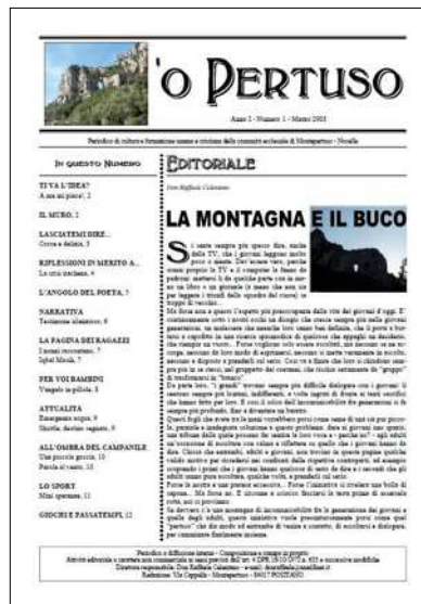
La copertina del numero 1

(2) Si riferisce al lavoro di impaginazione delle copie stampate; ma, come si è fatto notare spesso, questo è un lavoro per il quale servono non più di due o tre persone: di più creerebbero solo confusione; invece sarebbe utilissimo che altri lettori ci facessero pervenire degli articoli scritti da loro, senza stare a preoccuparsi di qualche errore. ■