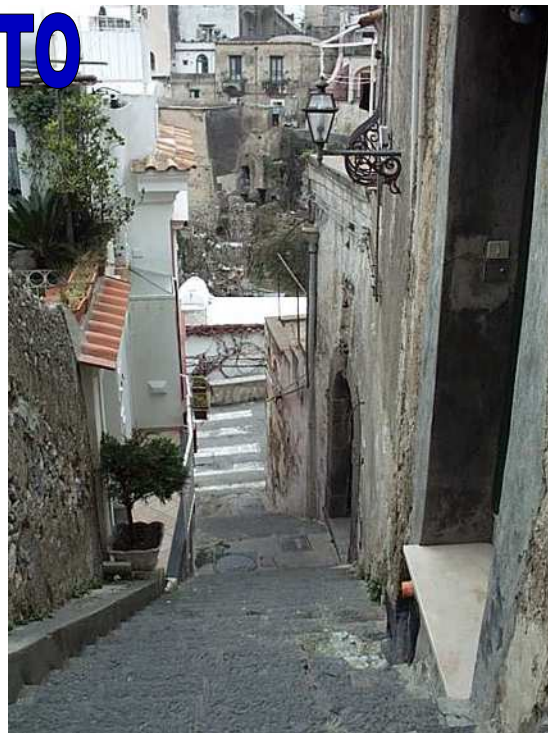
Via dei Merletti a Positano. In fondo alle scale, sulla destra, c'è l'antica denominazione "Scale Casale".

mazioni. In alcune registrazioni di morte, il luogo in cui il defunto abitava viene indicato con l'espressione "il Casale" oppure "allo Casale". Dove si trovava questo che aveva tutta l'aria di essere un rione dimenticato? Un primo indizio mi venne per caso, un giorno, salendo per la scalinata dove abito (oggi Via dei Merletti, vale a dire la scalinata che parte Via Pasitea, nei pressi del Ristorante "Saraceno d'Oro", e sbuca sulla stessa strada, in prossimità dell'inizio di Via Mangialupini); proprio all'inizio della scalinata, al disopra dell'indicazione del suo nome attuale, c'è una maiolica (più antica dell'altra) su cui è scritto: "Scale Casale". È solo un indizio, per di più molto vago; ma chi può negare che forse quella scalinata si chiamava così perché era compresa nel rione detto "Casale"? Registrai la notizia nell'apposita sezione del mio arrugginito cervello, restando in attesa di un colpo di fortuna che mi consentisse di individuare il luogo con maggior precisione.