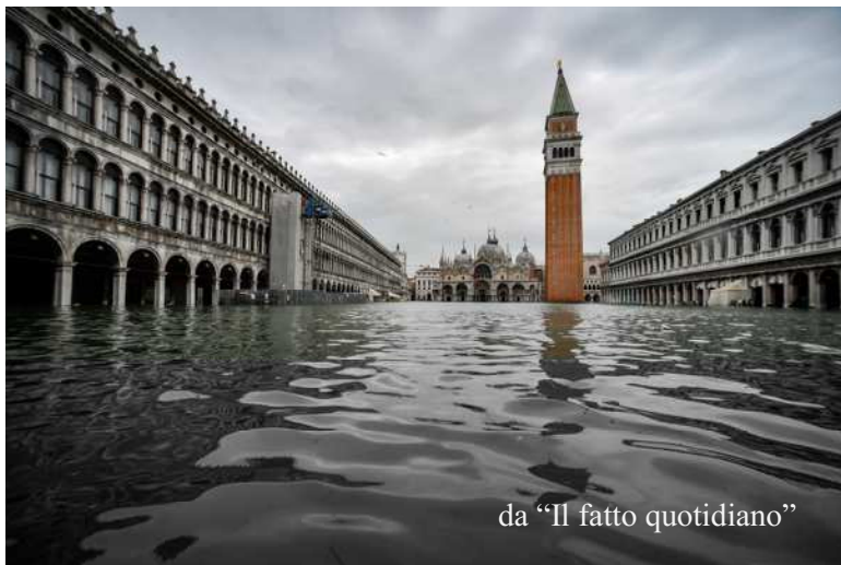
da "Il fatto quotidiano"

Io che ricordo l'alluvione di Maiori del 1954, frequentando le scuole medie ad Amalfi, ho ancora impresse nella mente le terribili imma-