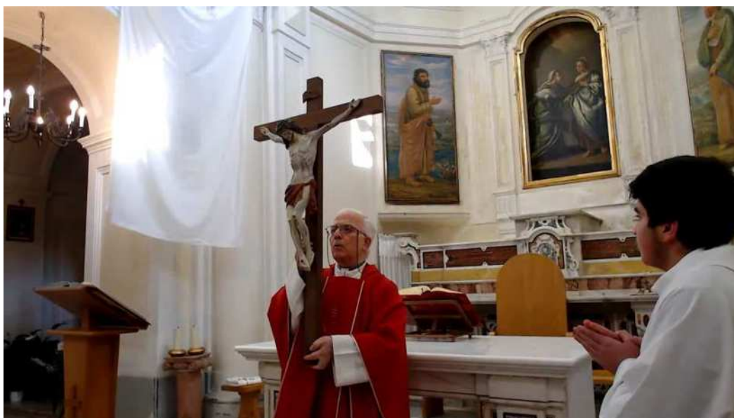
Passione del Signore