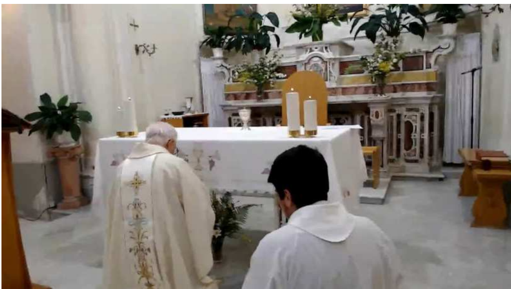
Cena del Signore