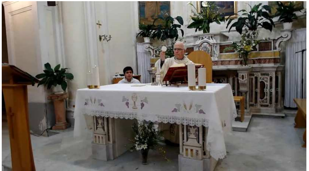
Cena del Signore