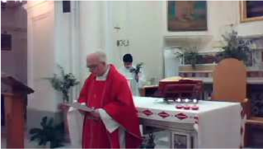
Domenica delle Palme