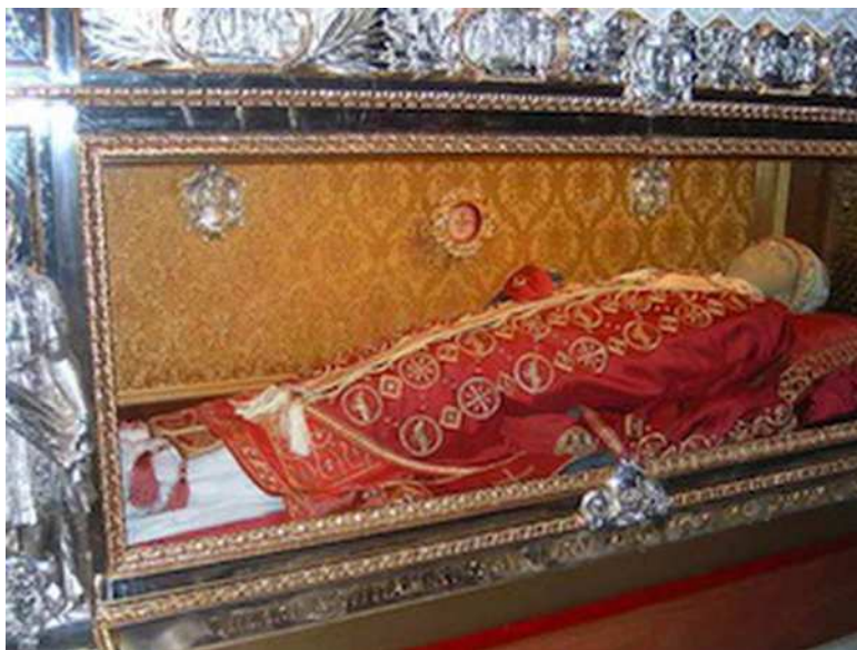
L'urna con le spoglie mortali di papa San Gregorio VII custodite nella cattedrale di Salerno

Ma l'imperatore è il tedesco Enrico IV, 25 anni, re in Germania e in Italia. Egli sfida apertamente il Papa facendo eleggere a Milano un vescovo di sua fiducia. Gregorio protesta vivacemente, ma Enrico, sostenuto da 30 vescovi tedeschi riuniti a Worms, dichiara deposto il papa ("il falso monaco Ildebrando", si legge nel documento). Gregorio VII scomunica Enrico, che per questo rischia di perdere il trono; vescovi e principi tedeschi gli impongono allora di riconciliarsi col Papa, in un incontro a Worms previsto nel febbraio 1077. Ma Enrico già in gennaio è davanti al Papa, che era ospite nel castello di Matilde di Canossa, sua fervente sostenitrice ma anche cugina dell'imperatore; questi si presenta al portone del castello indossando il saio dei penitenti, ma il Papa lo fa aspettare tre giorni e tre notti prima di riceverlo e di