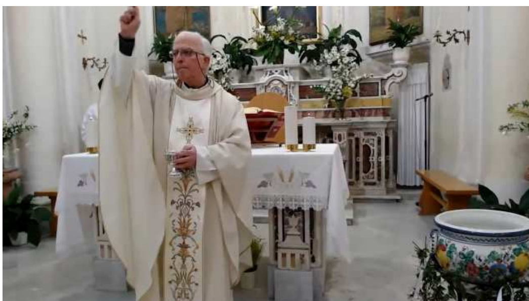
Domenica di Pasqua