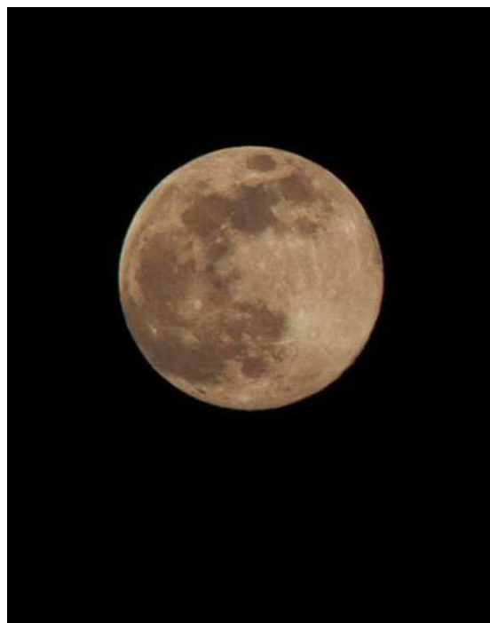
La luna piena di mercoledì 8 aprile

Poi Mosè fa una raccomandazione – meglio sarebbe dire che dà un ordine – agli israeliti: Celebreranno questo rito ogni anno, con le stesse modalità, nello stesso giorno dell'anno. È l'istituzione della Pasqua ebraica, il rito che ricorda appunto l'uscita degli ebrei dall'Egitto. «Questo giorno – dice Mosè – sarà per voi un memoriale...», cioè ogni volta che lo celebrirete si realizzerà di nuovo per voi, in modo misterioso ma reale, l'evento ricordato.