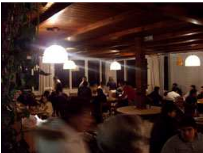
Uno scorcio della sala

Ma vorrei dirvi delle tombolate di questi giorni, quella