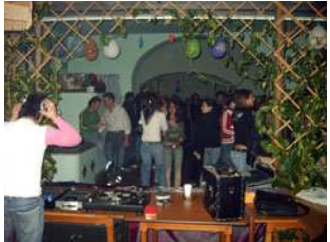
Uno scorcio della sala

Anche quest'anno dunque come quello passato abbiamo deciso tutti insieme di fare festa a modo nostro, in musica cioè; detto fatto, il tempo di riunirci e col consenso di don Raffi che inizialmente ci ha sponsorizzati garantendoci l'uso dei locali, abbiamo