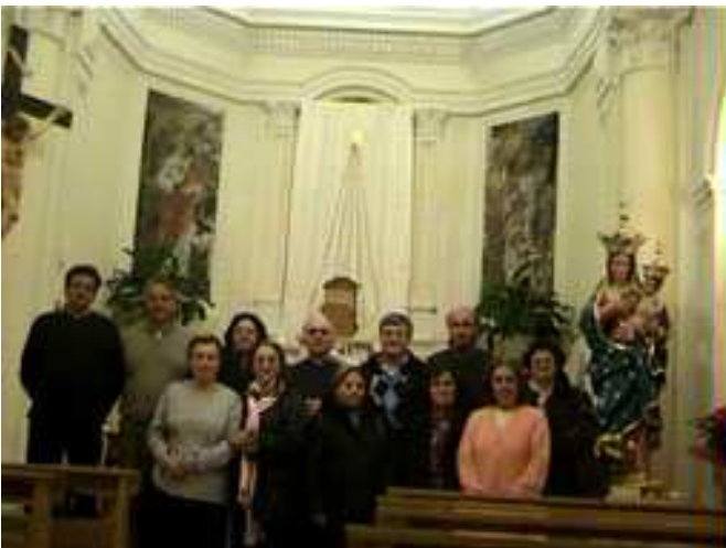
Il gruppo dei 50enni con il parroco dopo la celebrazione