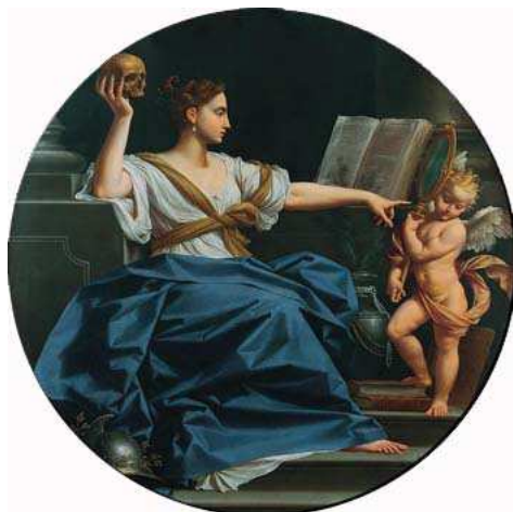
Donato Creti, Prudenza , Bologna, Palazzo Accursio

Una prima conseguenza di tutto ciò è che si possono assumere atteggiamenti ritenuti prudenti ma che nul-