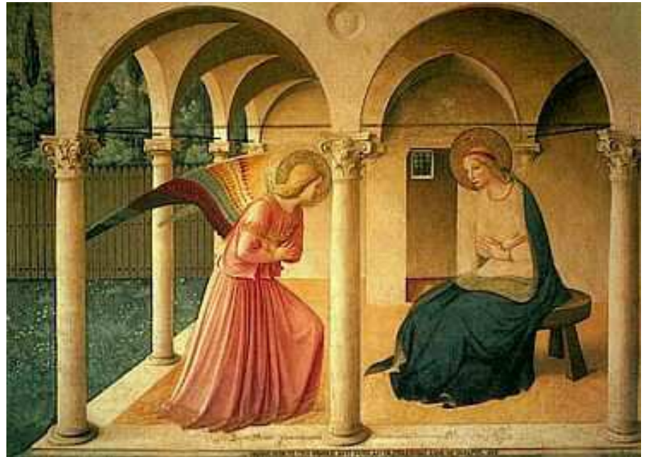
Beato Angelico, Annunciazione, Firenze - Convento di S. Marco

Come ho già detto qualche altra volta, è difficile trovare nei Vangeli molte notizie che riguardano la vita della Madonna. In questo caso però l’Evangelista è molto preciso nel raccontare gli avvenimenti. «L’angelo Gabriele, fu mandato da Dio in una città della Galilea, chiamata Nazaret, a una vergine promessa sposa di un uomo della casa di Davide, chiamato Giuseppe. La vergine si chiamava Maria. Entrando da lei, disse: “Ti saluto o piena di Grazia, il Signore è con te”. A