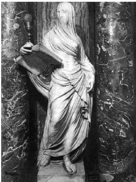
Innocenzo Spinazzi, La Fede, Chiesa S. M. Maddalena dei Pazzi, Firenze

«Il discepolo di Cristo non deve soltanto custodire la fede e vivere di essa, ma anche professarla, darne te-