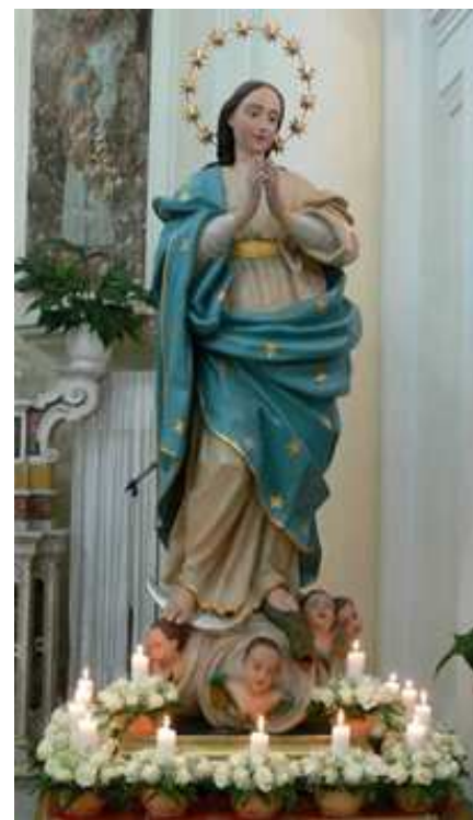
La statua dell'Immacolata il giorno della Prima Comunione, con ai piedi i ceri accesi portati dai bambini