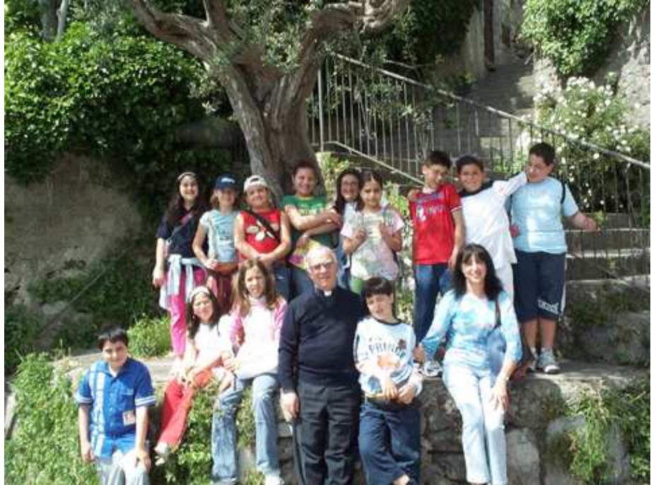
Sabato 20 maggio a Nocelle: foto di gruppo prima di iniziare il ritiro