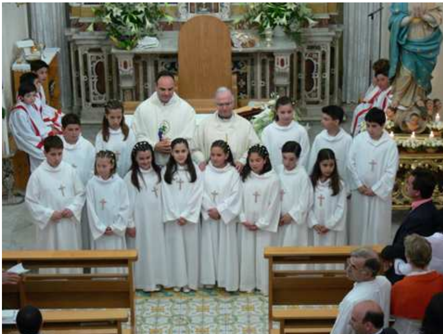
Domenica 21: foto di gruppo al termine della cerimonia

Altre foto della festa sono visibili nel sito web della nostra parrocchia: www.montepertuso.it/immagini8.htm