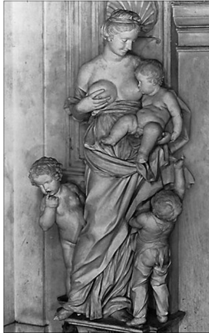
Serpotta - La Carità (Palermo, Oratorio di S. Lorenzo)

Nella lingua greca ci sono tre termini diversi per definire l'amore. Con “eros” si indicava l'amore sensibile, ossia ogni amore rivolto al bene che può suscitare desiderio dai sensi. Con “filia” si indicava l'amore affettivo-sentimentale, l'amore di amicizia. Con “agàpe”, infine, si indicava un amore, una predilezione del tutto disinteressati. Questi tre termini li ritroviamo anche nel nostro linguaggio, rispettivamente con “erotismo” (usato anche nella espressione originale, eros), amicizia e carità. Qui ci interessiamo solo di quest'ultimo, che purtroppo spesso assume solo la valenza del “fare