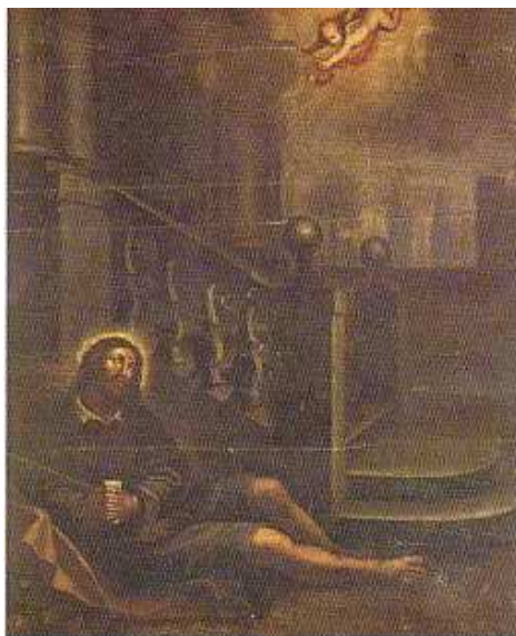
S. ALESSIO Basilica di S. Alessio - Roma

Le tre leggende si somigliano un poco tutte. Si racconta infatti che Alessio era figlio di un patrizio romano, il senatore Eufemiano, e di Aglae. Andato in sposo a una fanciulla patrizia romana, la sera delle nozze lasciò illibata la sua sposa e sentendo la chiamata del Signore abbandonò la sua casa per intraprendere un pellegrinaggio. Giunto a Edessa, città della Siria, si mise a chiedere l'elemo-