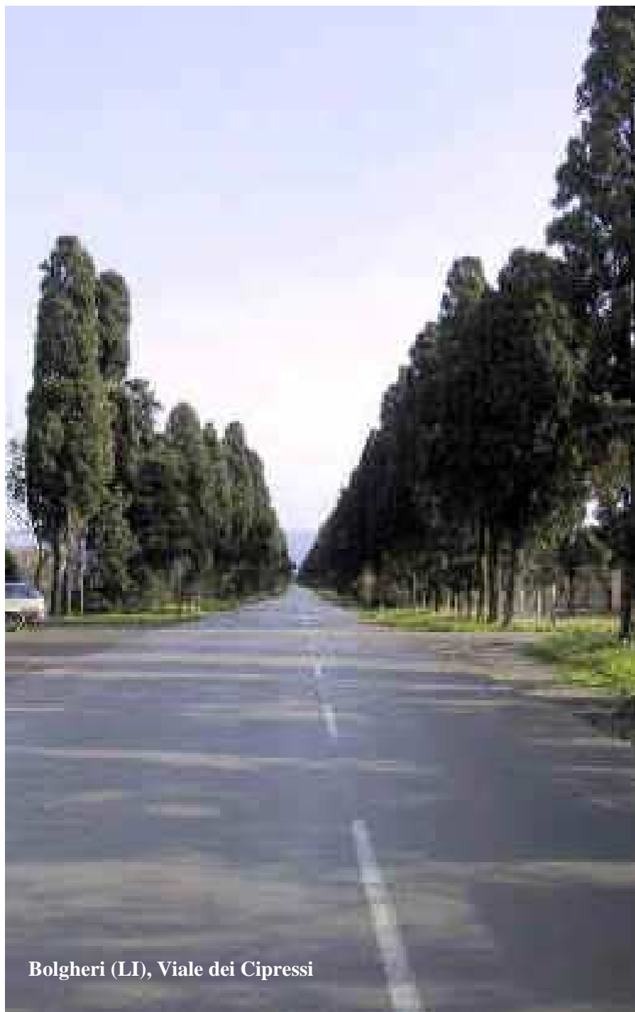
Bolgheri (LI), Viale dei Cipressi

Periodico a diffusione interna - Composizione e stampa in proprio Attività editoriale a carattere non commerciale ai sensi previsti dall'art. 4 DPR 16/10/1972 n. 633 e successive modifiche Direttore responsabile: Don Raffaele Celentano - e-mail: donraffaele@alice.it Redazione: Via Montepertuso - 84017 POSITANO www.montepertuso.it