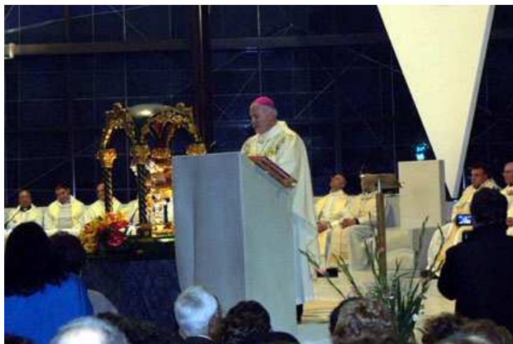
Omelia di Mons. Soricelli durante la Messa conclusiva al Santuario del Divino Amore

Alle 19 abbiamo ripreso la via del ritorno a casa, dove siamo giunti intorno alle 23, stanchi ma grati al Signore per la bellissima esperienza.