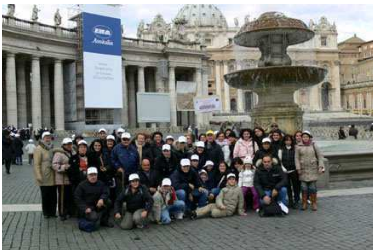
Il gruppo dei pellegrini di Montepertuso in Piazza San Pietro

regalità storica: egli vuole regnare nei cuori delle persone. Ed è proprio il cuore dell'uomo il luogo in cui il suo regno è "a rischio", perché lì egli deve confrontarsi con la nostra libertà. Praticare iniquità o giustizia, dunque, è una scelta di libertà, dipende da noi; da questa scelta dipende poi la nostra sorte futura, il nostro essere associati al suo regno o esserne allontanati.