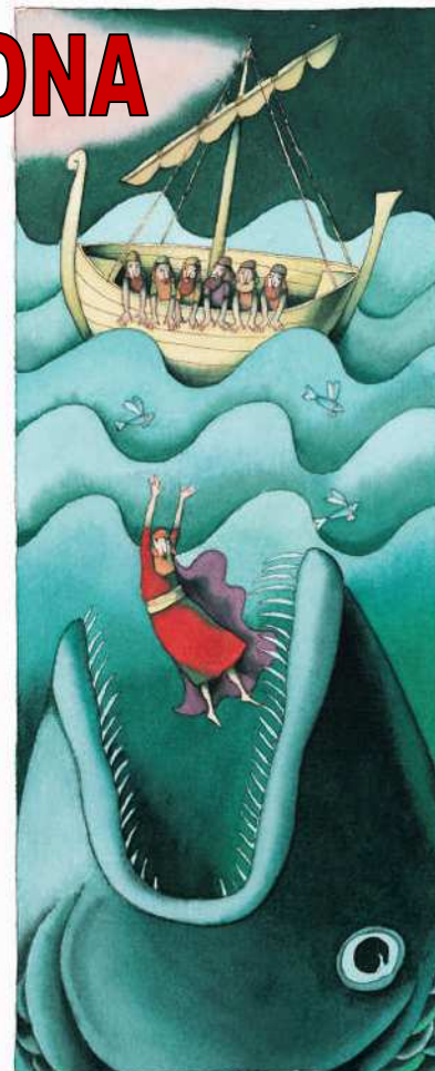
Immagine: Giovanni Manna, Giona e la balena, da Roberto Brunelli, La Bibbia narrata ai ragazzi