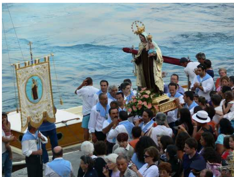
12 luglio - L'arrivo della statua al molo di Positano