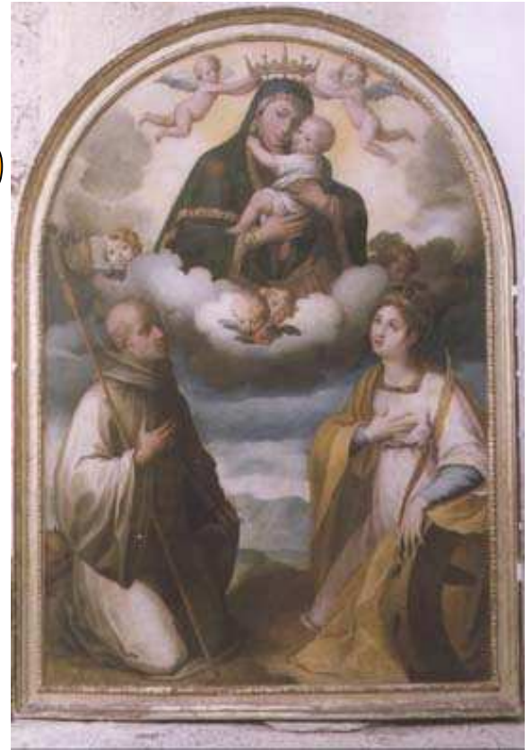
San Simone Stock raffigurato insieme a Santa Caterina d'Alessandria nel quadro della Madonna del Carmine che si trova nella parrocchia di S. Maria Assunta in Positano

Verso il 1247, all'età di 82 anni, fu scelto come