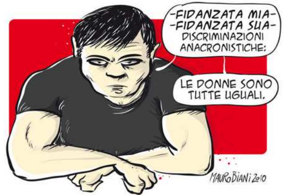
vignetta ripresa da "Liberazione", sabato 7/8/2010

Peccato! Sarebbe stato interessante conoscere il suo pensiero su questo aspetto fondamentale del problema: l'amante che si sente padrone dell'amato e arriva anche a concepire il pensiero aberrante di una connessione tra amore e omicidio. Non c'è e non può esserci, e non può essere accettato neanche come sbocco di rassegnata impotenza, un legame logico tra amare e uccidere: i due verbi sono uno la negazione dell'al-