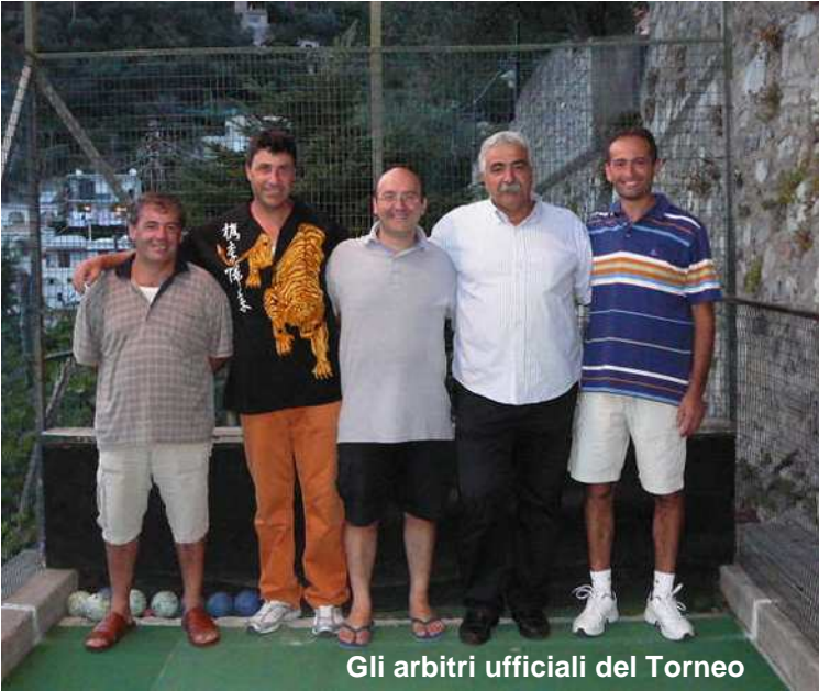
Gli arbitri ufficiali del Torneo