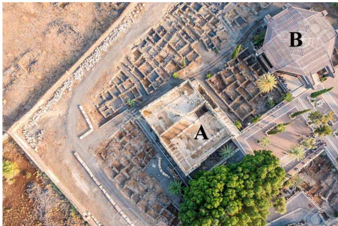
Veduta aerea di Cafarnaon: A - La sinagoga - B - La chiesa ottagonale edificata sul luogo della casa di Pietro.